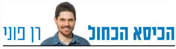
הכיסא הכחול רן פוני

שורשי המנגל: למה אנחנו מנפנפים? רן פוני, עמ' 14