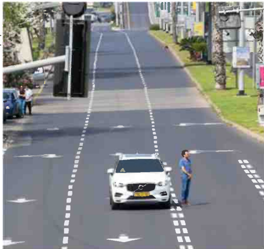
מחדירה בכוח את הזיכרון. בעת הצפירה בתל אביב