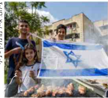
על האש, קריית שמונה

הצמדת ימי הזיכרון והעצמאות תמוהה: "רוב המדינות בעולם, כולל מדינות ערב, אירופה ואמריקה - מפרידות את יום הזיכרון מיום העצמאות. יש משהו בדנ"א היהודי שמרגיש בנוח עם ערבוב של עצב ושמחה. הסמיכות הזאת התקבעה בתרבות שלנו"