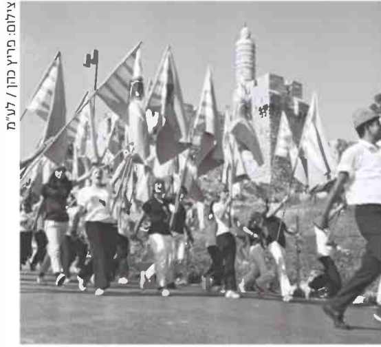
בעבר אנשים השתעממו בבית. עצמאות בירושלים, 1970